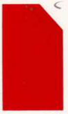
403 903 Vermillion