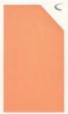
4787 9787 Apricot Slice