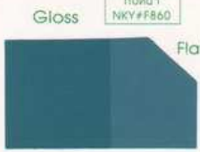
422 922 Blue Turquoise