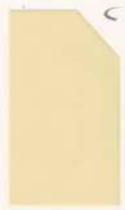
4784 9784 Warm Sun