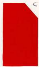
443 943 Permanent Red