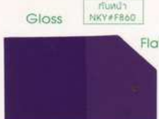
4750 9750 Princely Purple

หมายเหตุ โทนสีด้านหรือทึบเงาทึบ อาจแตกต่างกับแลคเกอร์เงาเล็กน้อย ทั้งนี้ เป็นผลมาจากความเงาของสีเปลี่ยนไป และกรรมวิธีสีที่ใช้ไม่เหมือนกัน