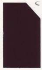
416 916 Brown