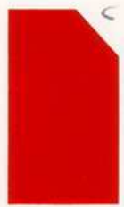
450 950 Sunrise