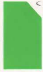
4752 9752 Seaside Garden