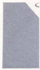
419 919 Silver