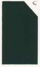
471 971 Vibrant