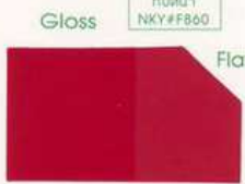
4756 9756 Red Reality