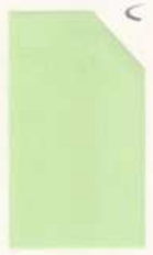
4783 9783 Green Sheen