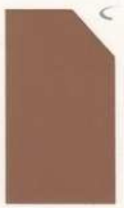
4798 9798 Cinnamon Sugar