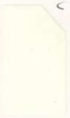
4781 9781 Frosty Lime