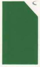
431 931 Apple Green