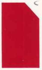
4756 9756 Red Reality