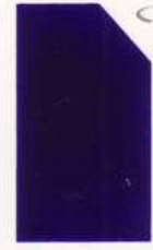
426 (สีพิเศษ) Royal Violet