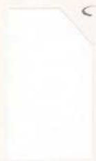
401 901 White