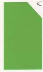
400 900 Lime Green