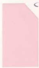
4782 9782 Casual Pink