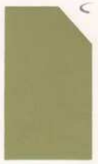
4792 9792 Agate Green