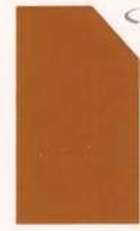
467 967 Oxide Yellow