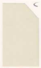
488 988 Wild Rice