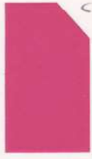
451 951 Pink