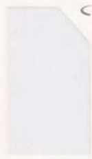
4780 9780 White City