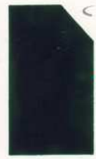
409 909 Dark Green