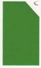
423 923 Green Grass