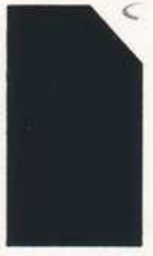
410 910 Medium Green