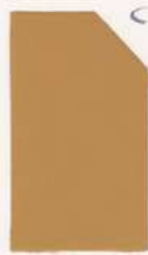
496 996 Golden Age