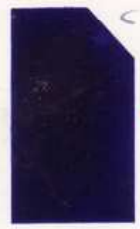
472 972 Prussian Blue