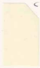
432 932 Eggshell