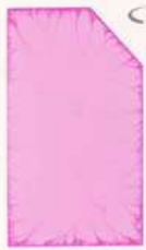
429 929 Rose