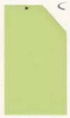
461 961 Green Bamboo