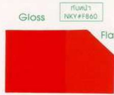
413 913 Orange

คำต้องการเปลี่ยนโทนสีเงา เป็นโทสด้านหรือทึบเงา สามารถทำได้หากำกับหน้า ด้วยแลคเกอร์ด้าน NKY F860 1-2 เทียว ขึ้นอยู่กับ โทนสีที่ต้องการ