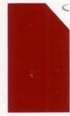
455 955 Indian Red