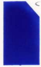
425 925 Dark Blue