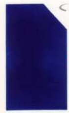
405 905 Pure Blue