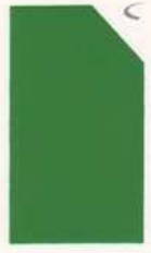
439 939 Green