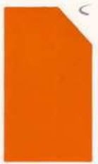
481 981 Yellow Medium