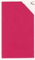
444 944 Sixty Pink