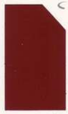
436 936 Lisbon Red