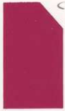
440 940 Purple