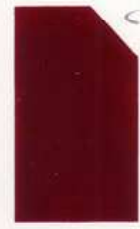
418 918 Maroon