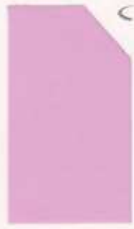
454 954 Migi Pink