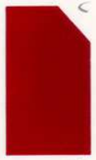
487 987 Crimson