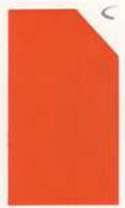
4755 9755 Jeweled Peach