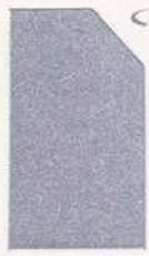
469 969 Metallic Silver สีร่อนขุ่นประกาย