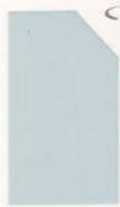
459 959 Cool Grey