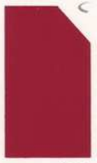
4797 9797 Red Zing