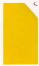
421 921 Canary Yellow