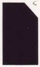
448 948 Deep Indian Red