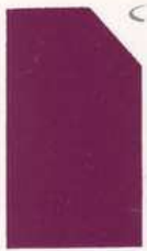
447 947 Orchid Violet