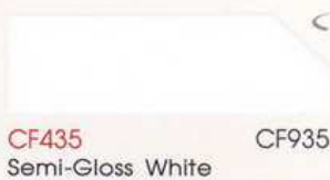
CF435 935 Semi-Gloss White