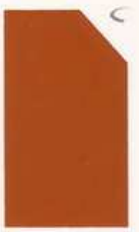
4791 9791 Caramel