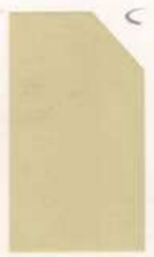
486 986 Pale Ivory