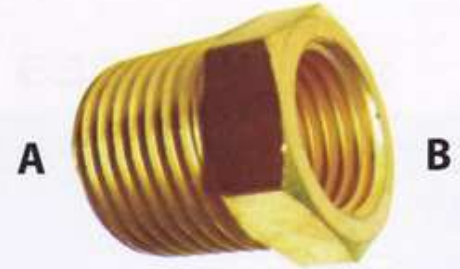
ข้อลด/ลดเหลี่ยม(เกลียวนอก-ใน) #3220