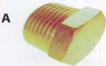
ปลั๊กอุด/ข้อต่ออุด เกลียวนอก #3129