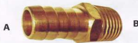
สวมสายยางหางปลาไหล (เกลียวนอก) #139