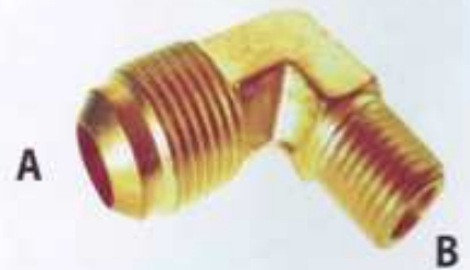
ข้อต่องอ แพลย์นอก+นอก