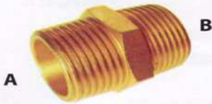
นิปเปิด (เกลียวนอก-นอก) #3325