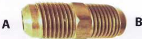
ข้อต่อตรง ยูเนียนแฟลย์