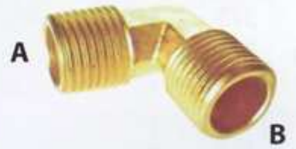
เกลียวนอก-เกลียวนอก