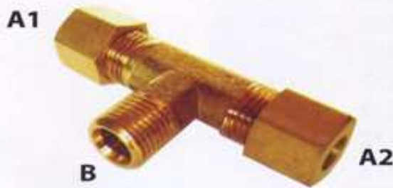
ข้อต่อสามทางตาไก่ 2 ข้างมีตัวผู้ด้านบน