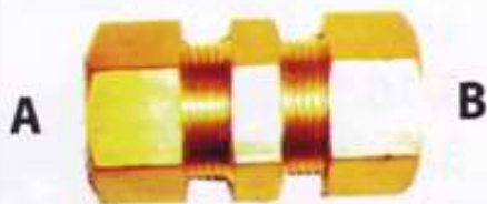
ข้อต่อยูเนียนตาไก่ 2 ข้าง