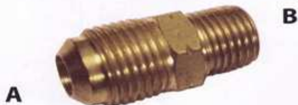
ข้อต่อตรง แพลย์นอก-นอก