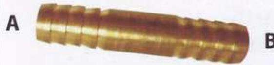
สวมสายยางทั้ง 2 ข้าง (หางปลาไหล) #138