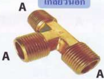
เกลียวนอก