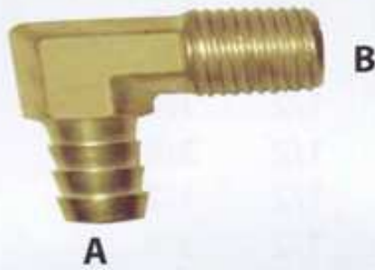
ข้องอสามสายยางหางปลาไหล - เกลียวนอก